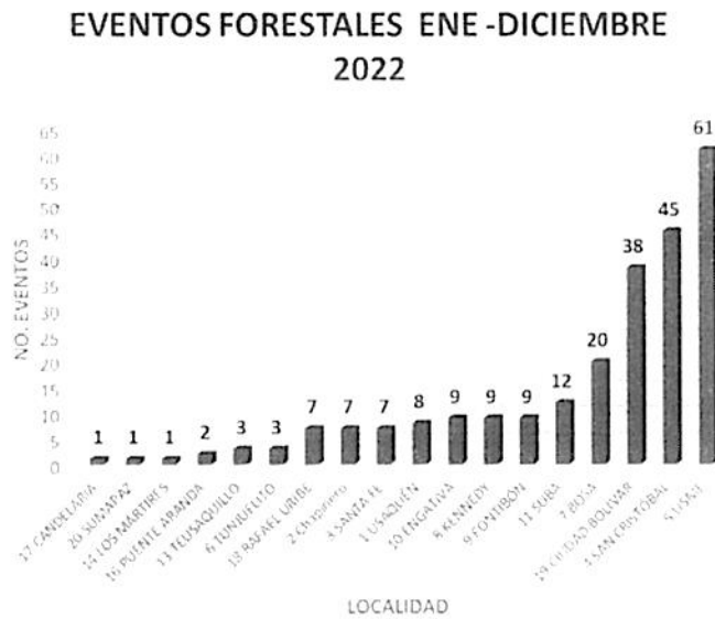
GRÁFICA 3. TOTAL DE EVENTOS FORESTALES Y ÁREA AFECTADA DE ENERO A DICIEMBRE DE 2022

Para finalizar, la SDA recuerda que, según lo acordado por la Comisión, a partir de enero de 2023, la clasificación de eventos se debe realizar de acuerdo con la definición de incendio forestal establecida por la Comisión Técnica Nacional Asesora para Incendios Forestales en 2022.