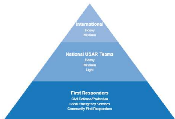
El marco de respuesta USAR de INSARAG

(Directrices INSARAG, Vol. I, 2.1). Por lo tanto, los estándares desarrollados para la acreditación de los equipos nacionales. debe estar alineado con la metodología INSARAG y, por lo tanto, debe reconocerse dentro de este mismo marco.