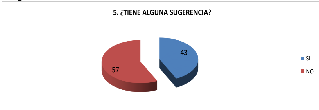
Gráfica N o 5

En la encuesta de satisfacción realizada se tienen en cuenta las sugerencias y o felicitaciones realizadas y recibidas por los ciudadanos de acuerdo al porcentaje de inconformidad, para toma de acciones de mejora que permitan ofrecer un servicio integral de calidad.