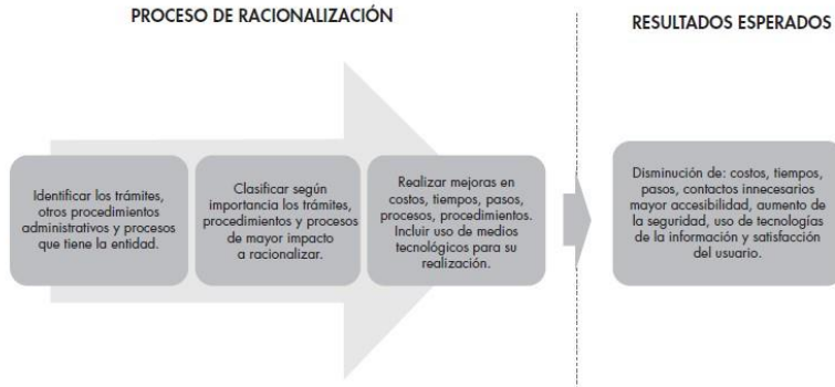
Imagen 1.

Para el logro de los anteriores objetivos se han formulado las siguientes acciones teniendo en cuenta la metodología y herramientas facilitadas por el DAFP para la racionalización de trámites.